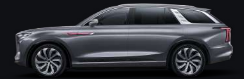
Серый Quantum silver grey