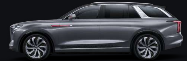
Серый с чёрной крышей Quantum silver grey + black roof