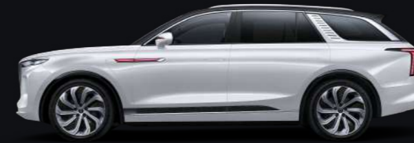
Белый с чёрной крышей Alpine white + black roof