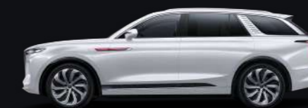
Белый Alpine white