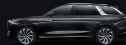
Чёрный Night black